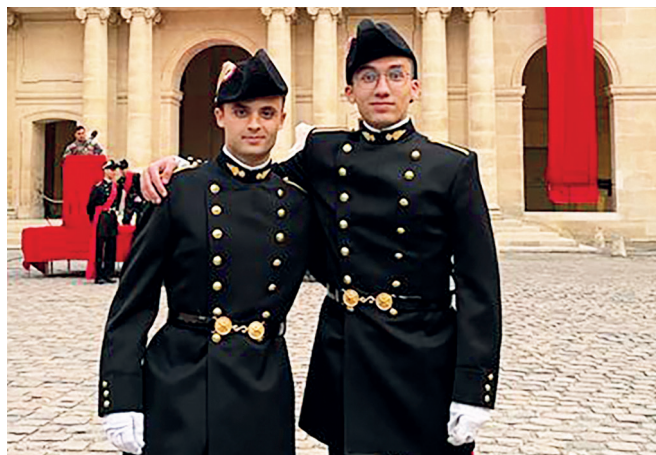
Les élèves polytechniciens passent 6 mois de stage chez ALIS.

L'équipe permanente d'ALIS est composée de 10 collaborateurs salariés ou bénévoles dont des élèves de l'École Polytechnique. Les bénévoles endossent des fonctions telles que la prise en charge de la comptabilité, la gestion du site Internet, la gestion du parc d'équipements de communication, etc.